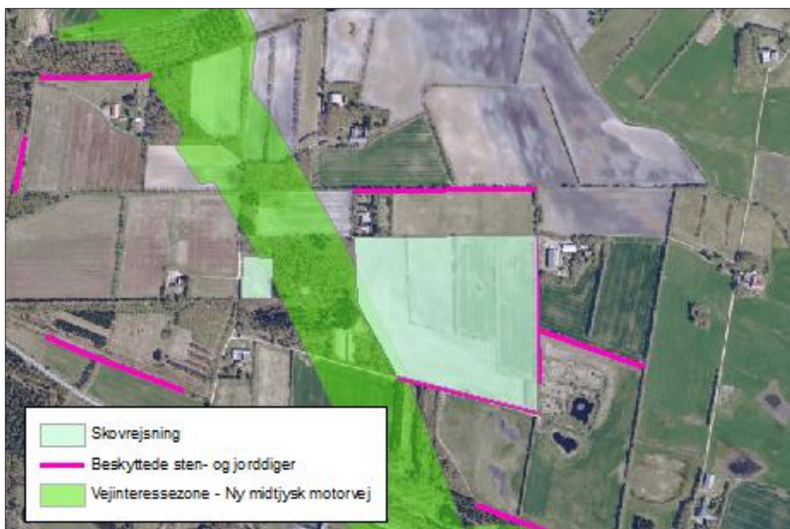
Figur 1: Oversigtskort over ansøgte skovrejsningsområde.

Der er nærmere redegjort for de vurderinger, der ligger til grund for afgørelsen i vedlagte screeningsskema med kortbilag.